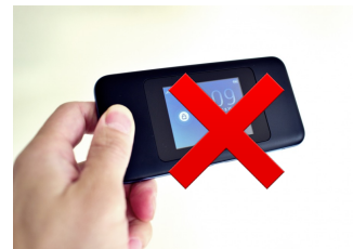
モバイルWi-Fiでは 容量が足りません